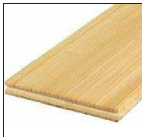
NATURAL ( A PEDIDO)