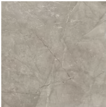
Color: Gris Oscuro

Nota: Los pisos cerámicos, gres cerámico, gres porcelánico y porcelanatos brillantes cuentan con una gran resistencia. Sin embargo, con el paso del tiempo, pueden volverse opacos en las zonas de mayor tránsito y uso. Debido a la condición de brillo, es inevitable que se presente rayado. Por esta razón, no se aceptan reclamaciones por rayado.